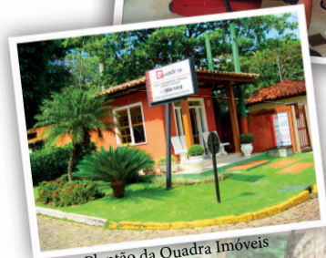
Plantão da Quadra Imóveis

Com o Costa Verde Tabatinga consolidado como um dos endereços mais desejados do litoral norte, nascia a Quadra Imóveis, uma imobiliária de alto padrão que surgiu com um propósito maior que intermediar vendas: construir histórias e conexões duradouras.