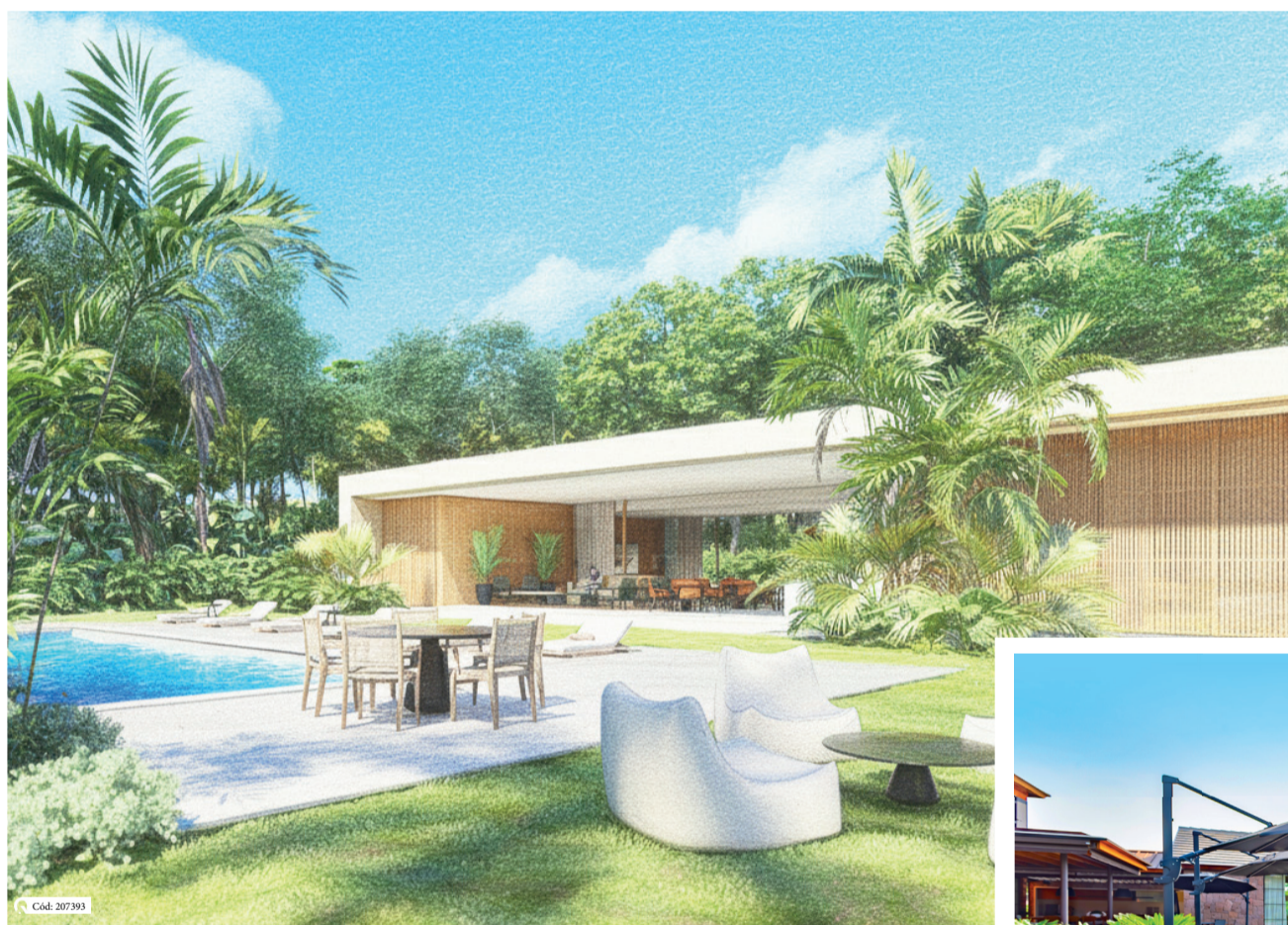
Boa Vista Village

Segundo Caíque, sócio e gerente da QR Campo, “a principal característica desses condomínios, é o acesso. Hoje, com as altas temperaturas, temos uma questão muito atrativa: ter a residência praticamente a poucos quilômetros do centro de São Paulo. Estamos falando de aproximadamente 100 quilômetros, o que traz o benefício de fugir do trânsito, dependendo do local de trajeto, e em menos de uma hora poder usufruir exatamente disso: ter o campo com suas principais características, infraestrutura completa e perceber que isso traz uma qualidade de vida muito melhor, porque o tempo de deslocamento você ganha com descanso, lazer e privacidade”. Outros condomínios da região que exemplificam esse cenário são a Fazenda Alvorada, o Condomínio Porto São Pedro e o Terras São José I e II.