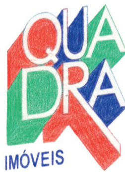
Primeiro logo da Quadra Imóveis