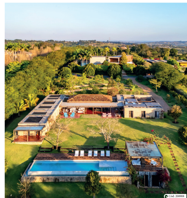
Fazenda Boa Vista

A Quadra Realty oferece imóveis em condomínios planejados com qualidade, segurança e infraestrutura, reunindo lazer, serviços e privacidade. A experiência dos moradores reforça o cuidado em cada detalhe. Com opções que vão de casas prontas a terrenos, a empresa atende diferentes perfis e necessidades, permitindo que cada família encontre o imóvel ideal para aproveitar o ano inteiro.