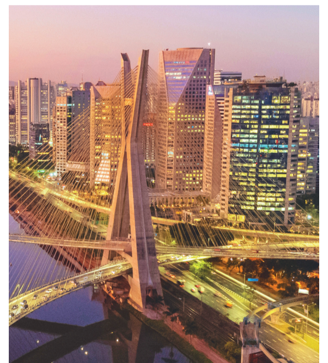
Ponte Estaiada, São Paulo

Essas dinâmicas apontam para uma tendência de expansão para polos estratégicos, com infraestrutura consolidada e fácil acesso logístico. A Quadra Corporate acompanha de perto essas mudanças e atua de forma proativa para posicionar seus clientes nos mercados mais promissores.