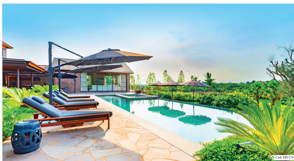
Fazenda Boa Vista