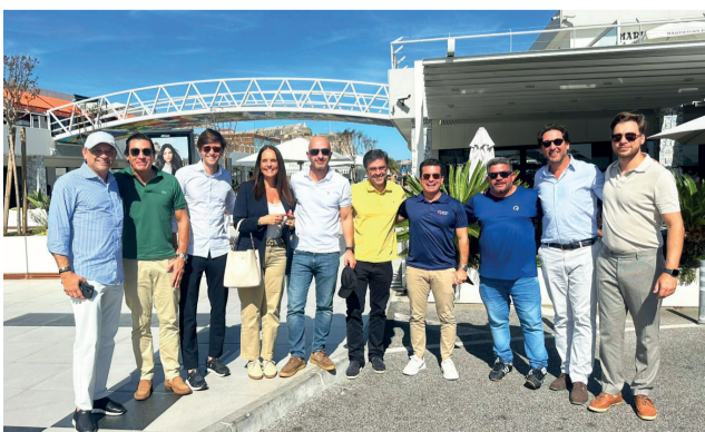
Conexão Grupo Quadra e Porta da Frente

Com essa expansão, a Quadra Realty reafirma seu compromisso em oferecer aos seus clientes experiências imobiliárias únicas e investimentos de alta performance. Mais do que uma nova frente de negócios, a chegada da marca ao mercado português simboliza a consolidação de uma ponte entre dois universos que compartilham valores, cultura e visão de futuro. Portugal passa a integrar a trajetória da Quadra Realty, um novo destino que reflete a união entre tradição e modernidade, história e inovação, qualidade de vida e excelência em investimentos.